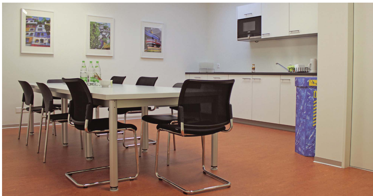
Seite 14: Das neue Elektro-Fahrzeug des Liegenschaftsdiensts.

Mit der Schulstrasse 9 inklusive dem nebenliegenden Parkplatz des Restaurants Rössli erhält die Einwohnergemeinde ein Grundstück, das für zukünftige Lösungen auf dem Wehrlin-Areal mit seinen engen Platzverhältnissen einen wichtigen Stellenwert einnimmt. Bis dahin wird das Gebäude für eine Zwischennutzung zur Verfügung stehen. An der Gemeindeversammlung vom Dezember 2017 wurde der Landabtausch angenommen. Somit können beide Parteien ihre zukünftigen Planungen ohne Einschränkungen und im Sinne einer durchdachten, gesamtheitlichen Idee durchführen.