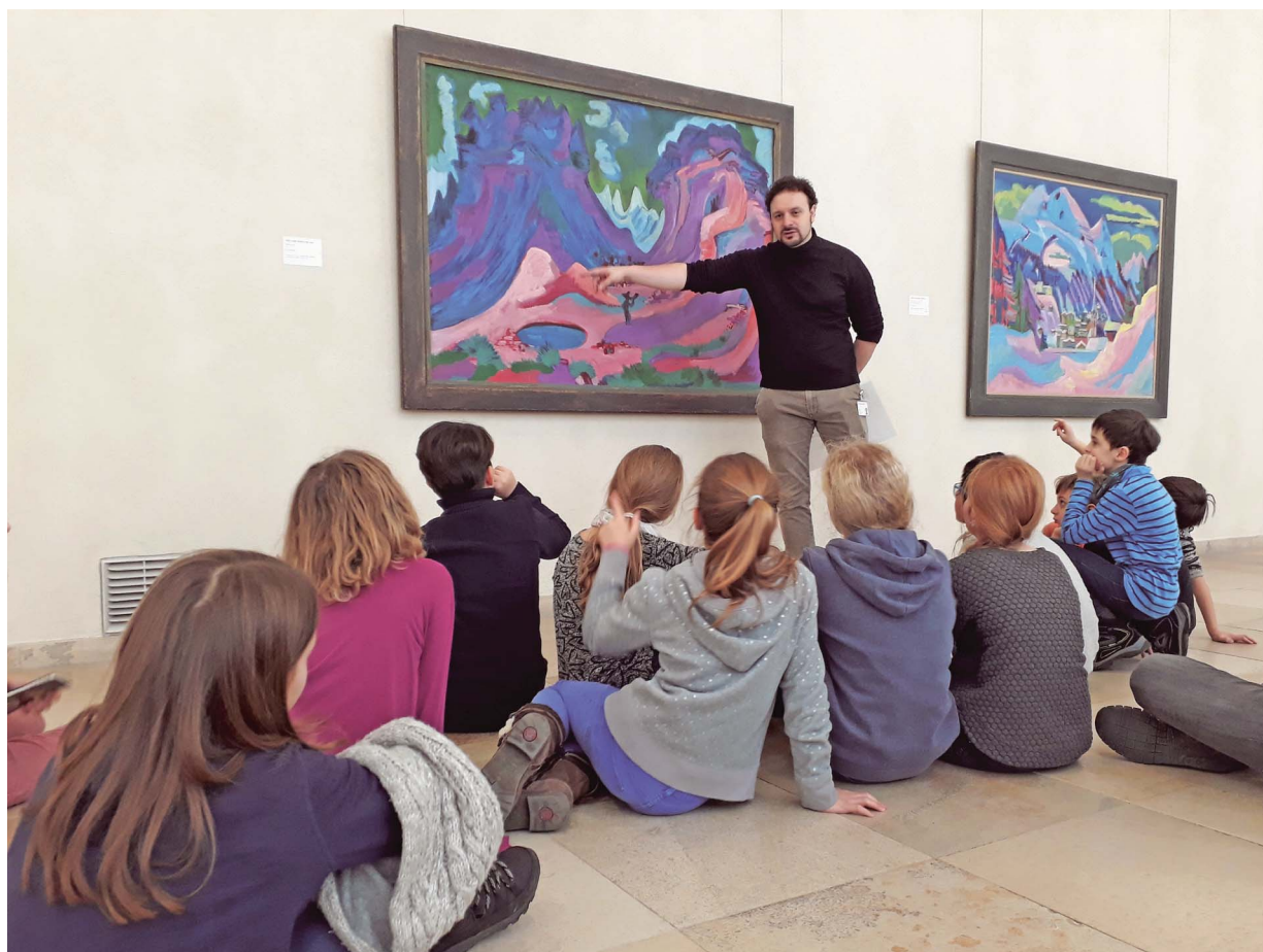
Seite 8: Spielsachen in den Tagesstrukturen Thomasingarten.

Für die Primarschule Oberwil hört die Bildung nicht hinter der Klassentüre auf, sondern sie legt Wert darauf, dass das Erlernete auf Exkursionen, Schulreisen, Lagern und während Projektwochen (be-)greifbar wird.