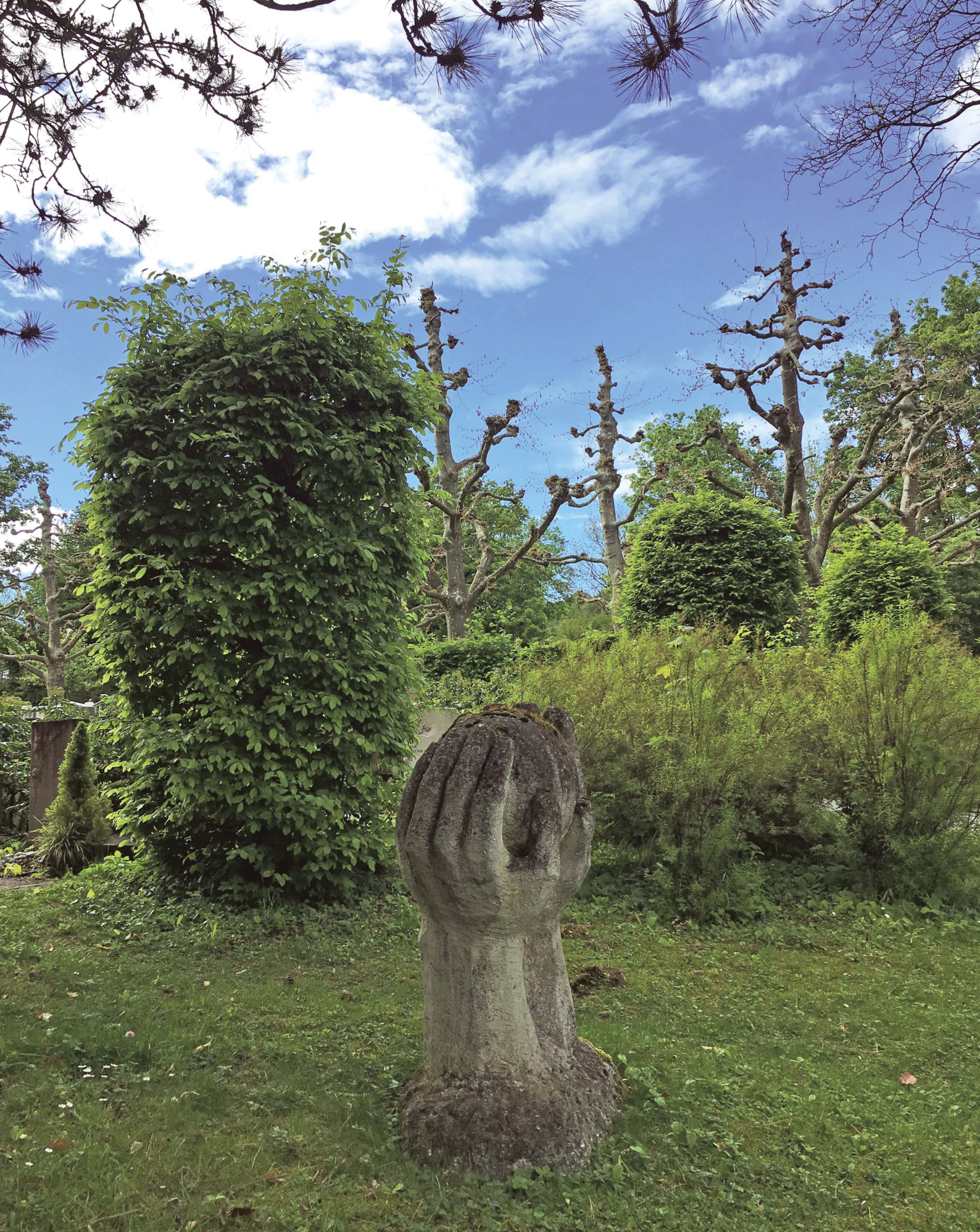
Seite 31: Skulptur auf dem Waldfriedhof Rüti – Foto aus dem Fotowettbewerb «Typisch Oberwil» (Fotografin: Annette Meyer López).